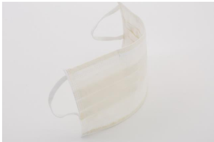
『kokua UV CUT MASK』 http://kokua.jp